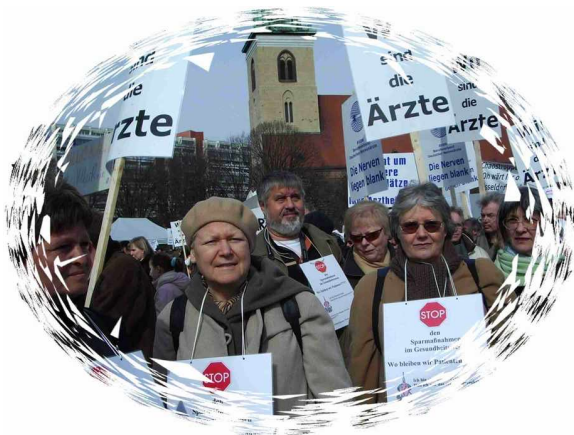
Patienten/innen aus Hamburg und Berlin

Mit dem Demonstrationszug zogen einige von uns, die noch gut zu Fuß waren, in Richtung Brandenburger Tor um an der Abschlusskundgebung teilzunehmen.